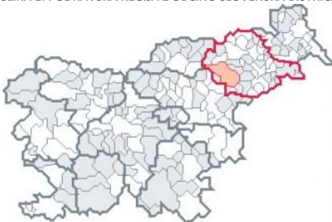
SLIKA 1: PODRAVSKA REGIJA Z OBČINO SLOVENSKA BISTRICA

Regijo sestavlja 678 naselij. V regiji je po podatkih Statističnega urada RS na dan 1. 1. 2021 živelo 328.469 prebivalcev. Delež prebivalstva v strukturi prebivalstva Republike Slovenije je v zadnjih nekaj letih konstanten.